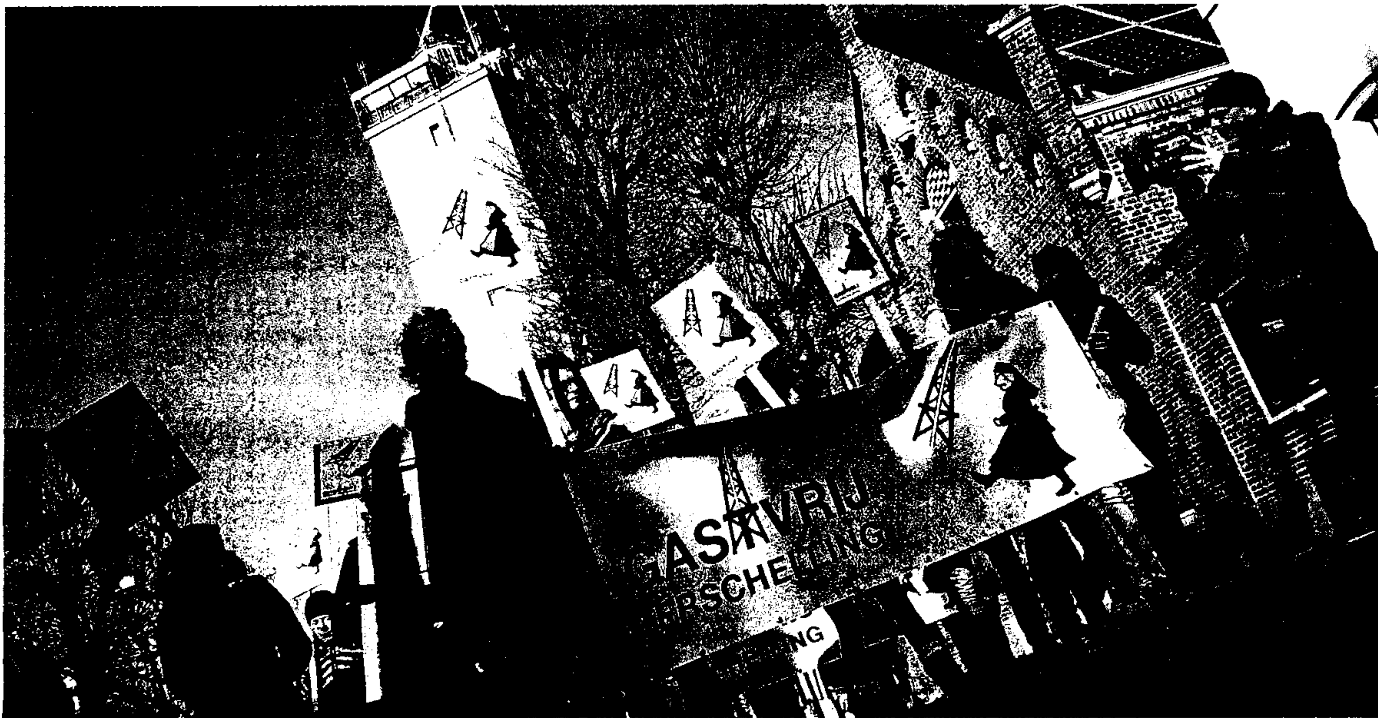
De demonstratie van Gas(t)vrij Terschelling was tevergeefs, oud-minister Sybilla Dekker kwam uiteindelijk niet.